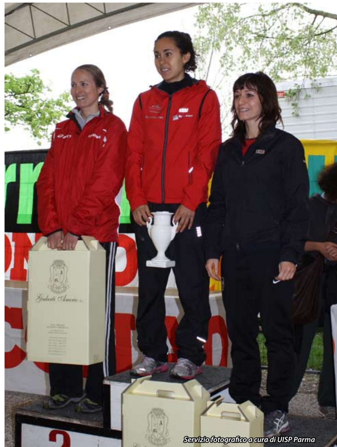
Servizio fotografico a cura di UISP Parma