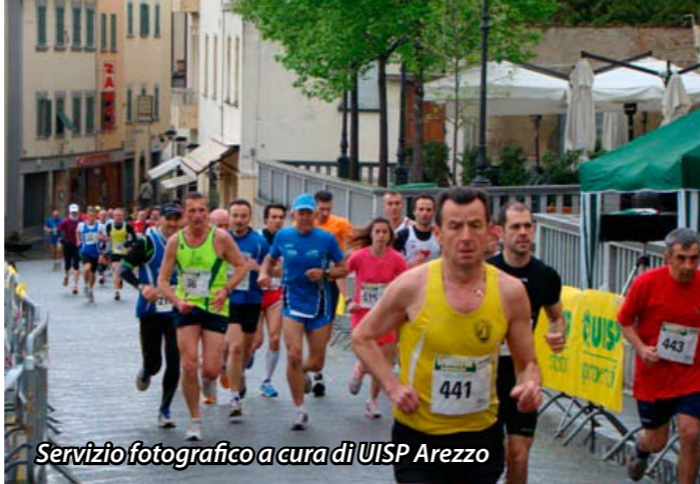
Servizio fotografico a cura di UISP Arezzo