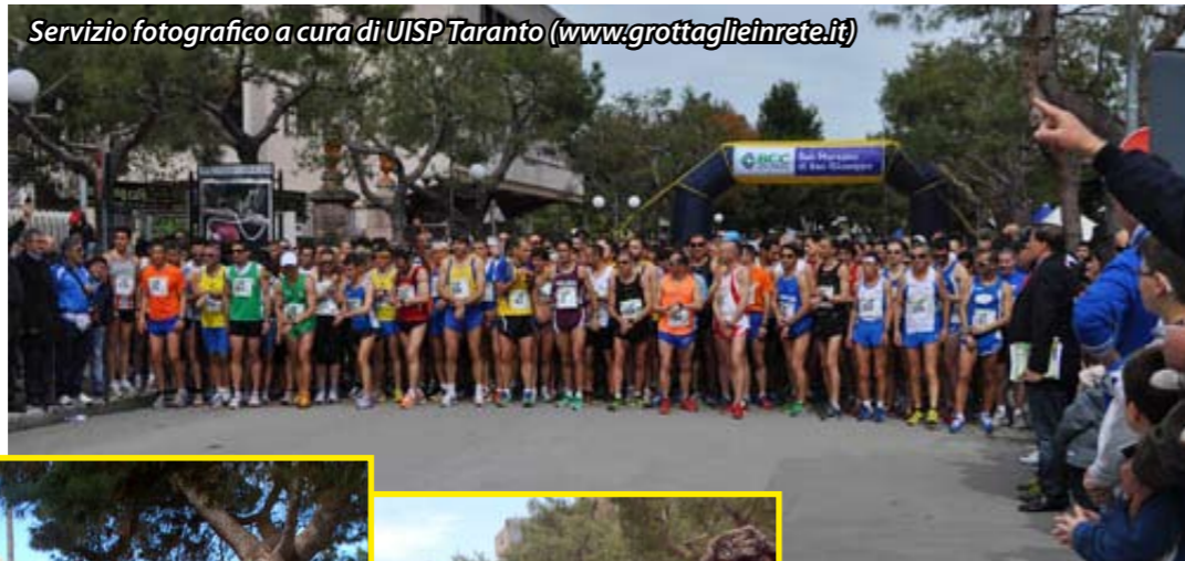
Servizio fotografico a cura di UISP Taranto (www.grottaglieinrete.it)