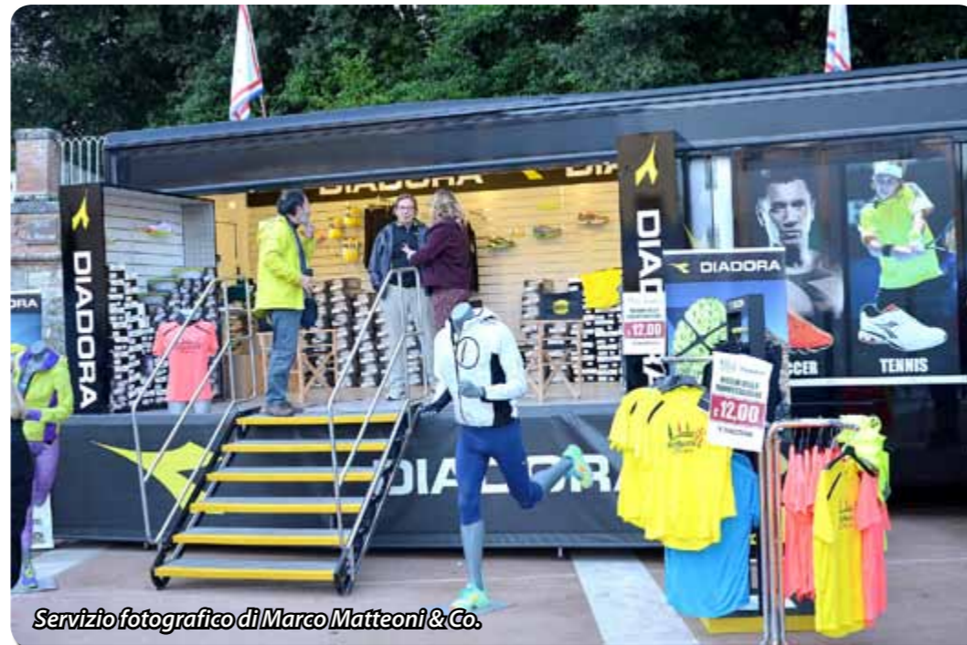
Servizio fotografico di Marco Matteoni & Co.