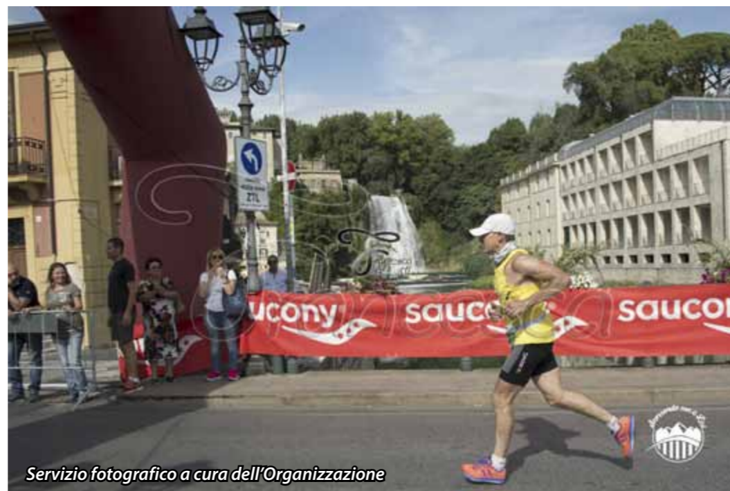
Servizio fotografico a cura dell'Organizzazione