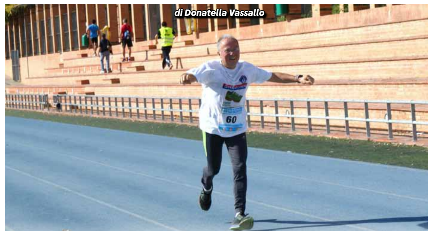
di Donatella Vassallo

Chissà cosa avrebbe pensato Franco Carati di questo manipolo di senesi che nell'ultima settimana dello scorso febbraio si è affacciato come un formicaio per le ultime rifiniture dell'ultramaratona. Chissà cosa avrebbe commentato alla vista di alcune donne che, sotto la pioggia, scaricavano scatoloni, scherzando sugli uomini capaci di evaporare al momento del bisogno. Chissà se, in quanto uomo, avrebbe detto che, visto che abbiamo voluto la bicicletta, ora ci tocca pedalare. Chissà come avrebbe guardato gli atleti stupiti di ritrovarsi in un museo per ritirare i pacchi-gara. Chissà se li avrebbe incoraggiati quando, impauriti dall'arrivo del ciclone Golia, chiedevano se la