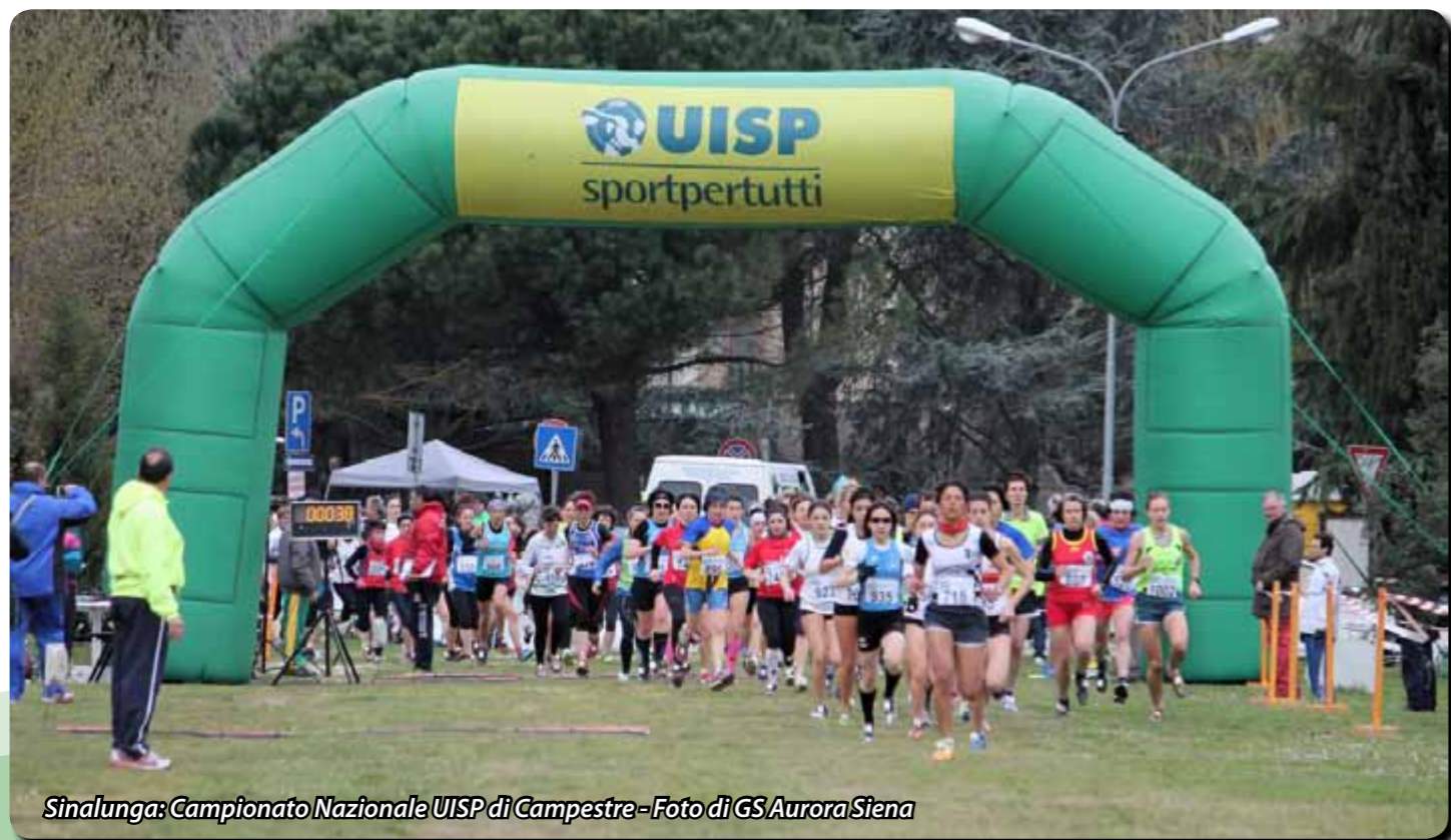
Sinalunga: Campionato Nazionale UISP di Campestre - Foto di GS Aurora Siena

Organizzazione: Fart Sport - Francavilla Al Mare info@abruzzogare.com Referente: Francesco Di Crescenzo cell. 347.3762165